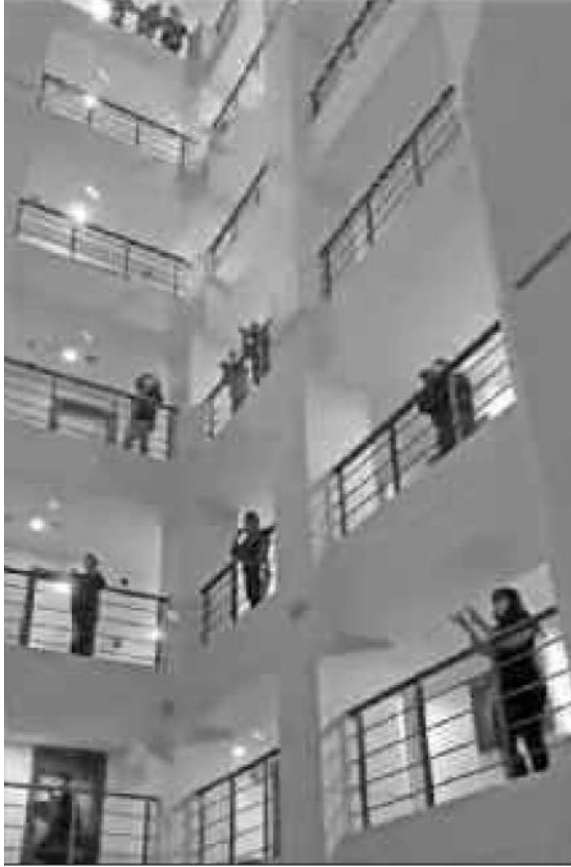
Karantinada kalan kişiler yurdun koridorlarına çıkarak alkışlarla sağlık çalışanlarına destek verdi.

İzmit'te Avrupa ülkelerinden gelerek Kredi Yurtlar Kurumu 'na bağlı Canfeda Hatun Öğrenci Yurdu 'nda karantina altında tutulan kişiler saat 21.00'de yurdun koridorlarına çıkarak sağlık çalışanlarına destek olmak için 1 dakika boyunca alkışladı